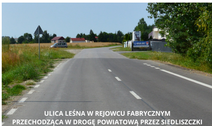
ULICA LEŚNA W REJOWCU FABRYCZNYM PRZECHODZĄCA W DROGĘ POWIATOWĄ PRZESIEDLISZCZKI

Warto również wspomnieć o niezrealizowanych dotąd planach dotyczących oznakowania dróg powiatowych na terenie gminy. Prace nad oznakowaniem poziomym dróg powiatowych stanowią ważny element działań mających na celu poprawę bezpieczeństwa ruchu drogowego. Wprowadzenie linii segregacyjnych na całej długości odcinka jezdni przyczyni się do znacznego usprawnienia czytelności oznakowania danego obszaru drogowego. Na zdjęciu widoczna ulica Leśna w Rejowcu Fabrycznym z oznakowaniem poziomym, przechodząca w drogę powiatową przez Siedliszczki, która nie posiada oznakowania poziomego.