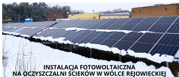
INSTALACJA FOTOWOLTAICZNA NA OCZYSZCZALNI ŚCIEKÓW W WÓLCE REJOWIECKIEJ

Dobiegają końca prace projektowe w ramach budowy kanalizacji sanitarnej na terenie gminy Rejowiec w miejscowości Kobyle. Wartość zadania to niecałe 2,6 mln zł. Cała sieć powinna zostać zainstalowana do sierpnia tego roku. Projekty na rozbudowę kanalizacji sanitarnej powstają również dla mieszkańców Hruszowa, Marynina oraz Wólki Rejowieckiej.