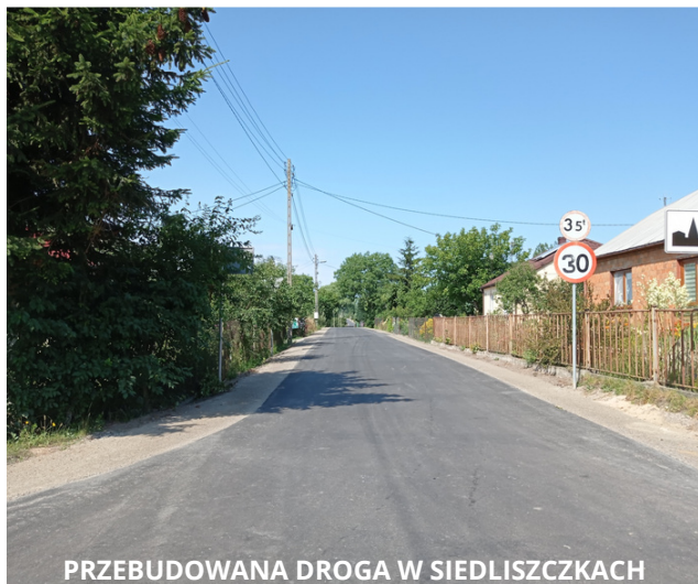
PRZEBUDOWANA DROGA W SIEDLISZCZKACH

W tym roku jeszcze bardziej rozświetlimy Miasto i Gminę. W ramach programu „Rozświetlamy Polskę” zaplanowaliśmy kontynuację prac polegających na modernizacji sieci oświetlenia ulicznego.