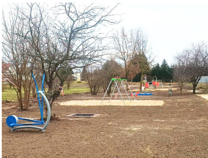
REJOWIEC, UL. SŁONECZNA