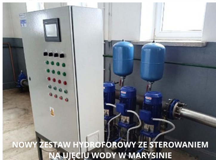
NOWY ZESTAW HYDROFOROWY ZE STEROWANIEM NA UJĘCIU WODY W MARYSINIE