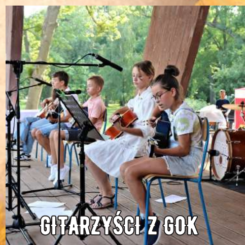
GITARZYŚCI Z GOK