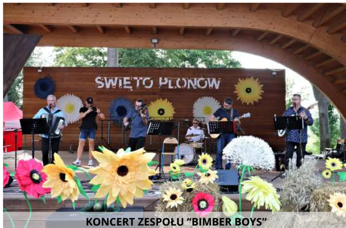
KONCERT ZESPOŁU "BIMBER BOYS"