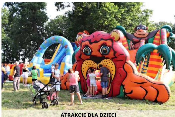
ATRAKcje DLA DZIECI