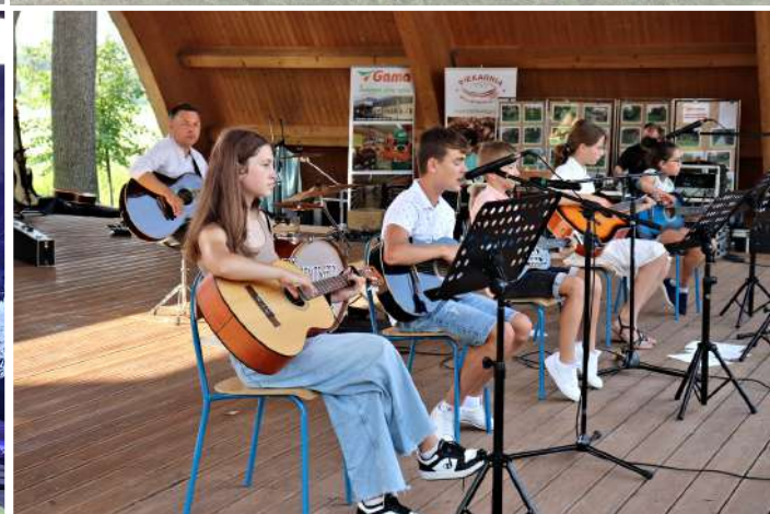
ZESPÓŁ GITAROWY Z GOK